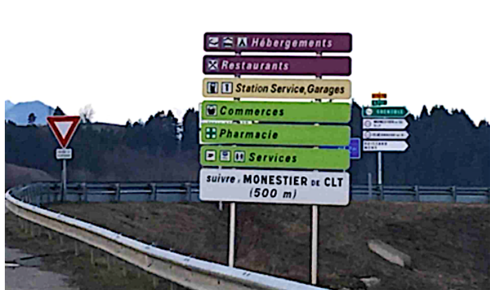
(Des exemples de ces panneaux)

Ils permettront de signaler aux automobilistes les différents commerces et services qu'ils sont susceptibles de trouver dans notre village.